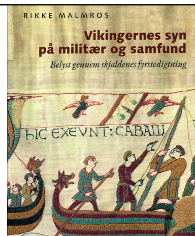
Foredraget tager udgangspunkt i ph.d. afhandlingen fra 2010.

Vikingskjaldenes lovprisninger af fyrster, flåder og tapre mænd er mere og andet end ren hofpropaganda. Fyrstedigtningen vidner om forhold og forandringer i de oldnordiske samfunds militære og civile organisation. Det er udgangspunktet for foredraget om en forståelse af vikingetidens og den tidlige middelalders poesi. Vikingetidens samfund betragtes gennem fyrstedigtningens rige kildemateriale, der længe har været oversat som gyldigt historisk vidnesbyrd. Fyrsternes digtere, skjaldene, priste den glansfulde ledingsflåde som kongens ypperste bedrift: 'Når kongen lader skibe fare over havet, forekommer det hans mænd, som var det Himmelkongens Engleskarer, der samlet svævede over vandet!'