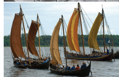
Jubilæumsudstillingen 'Hjerteblod – 50 år med vikingerne skibe' åbner 1. maj 2012.

Alle foredrag finder sted i Museumshallen og er gratis for medlemmer med ledsager. Kr.: 50,- for ikke-medlemmer